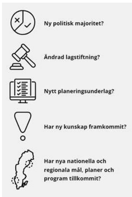
Bild 2. Lista över eventuella ändrade planeringsförutsättningar som kan påverka en översiktsplans aktualitet.

Vid bedömning av planens aktualitet har kommunen utgått från Boverkets lista över eventuella ändrade planeringsförutsättningar som kan påverka en översiktsplans aktualitet.